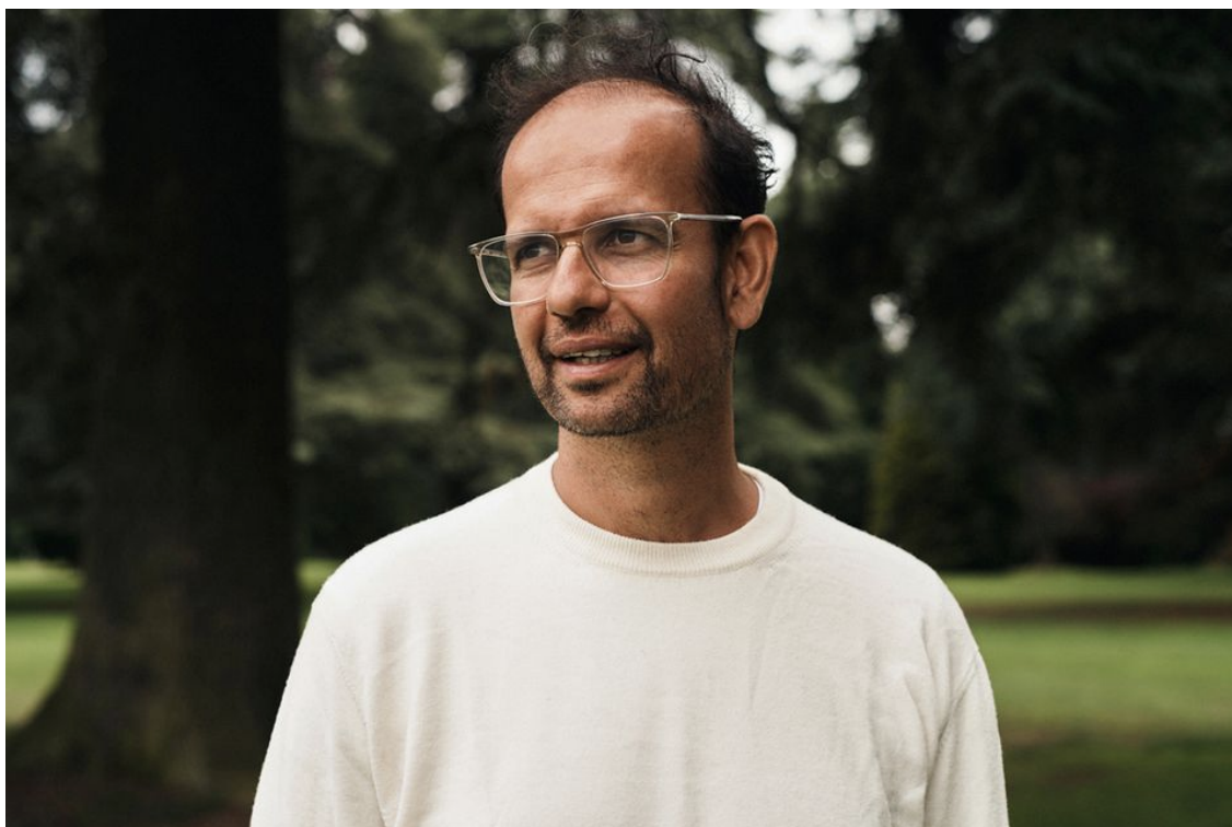
Tino Sehgal.