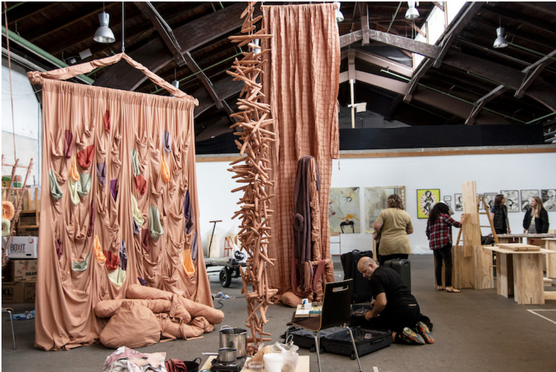
Juxtapose Art Fair på Godsbanen i Aarhus.

”Hvis bare 80 pct. lykkes, er Juxtapose Art Fair en succes”