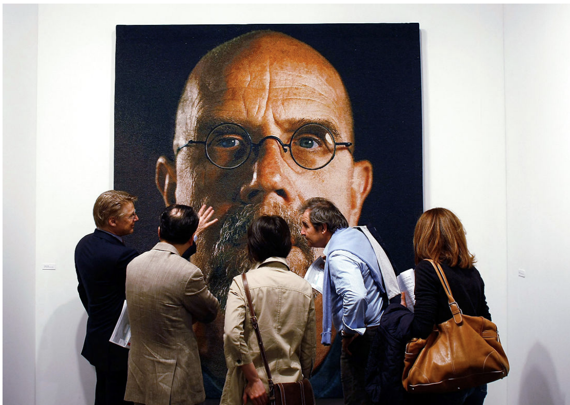
En gruppe kunstlere nærstuderer et Chuck Close-selvportræt.

de sene 1980'ere og tidlige 1990'ere så ud. (...) I betragtning af hvor mange af de hæfter, de arbejdede på, som i dag er klassikere, er det underligt, at deres navne er ikke er lige så kendte som forfatternes og tegnerens, der bidrog til de udgaver.”